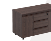
тумба для оргтехники