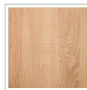
Дуб Сонома светлый